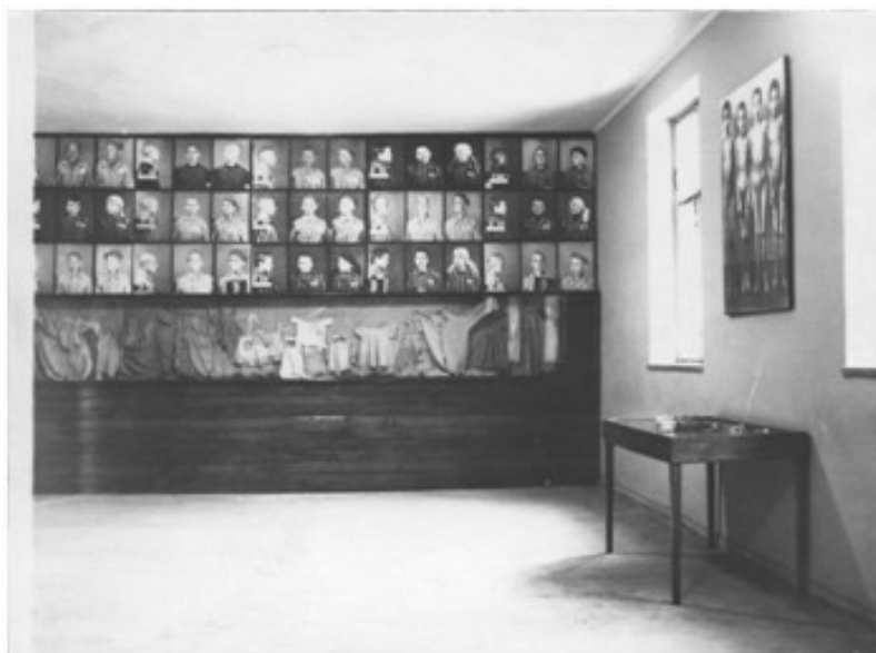
Fragment wystawy „Los matek i dzieci” w Państwowym Muzeum Auschwitz-Birkenau. Zdjęcie z roku 1966. Zdjęcia Czesławy Kwoki znajdują się w dolnym rzędzie.