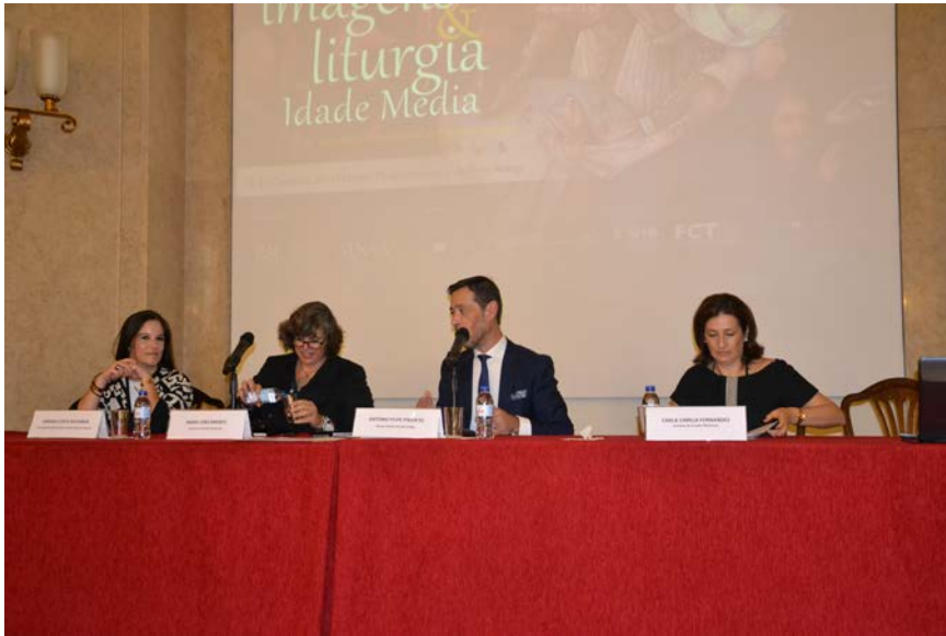
Figura 2 – Sessão de abertura do Colóquio Imagens e Liturgia na Idade Média