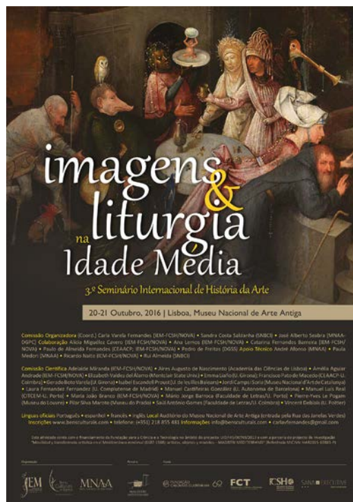
Figura 1 – Cartaz do Colóquio Imagens e Liturgia na Idade Média

Tal como no seminário anterior, e em virtude da disponibilidade e vontade demonstradas pelo SNBCI, foi possível produzir e editar o livro com os textos de muitas das comunicação e conferências apresentadas nesses dias. Os textos das comunicações foram sujeitos previamente ao processo de peer review e para tal contámos com um grupo de investigadores que se disponibilizaram a fazer a revisão de cada texto num curtíssimo espaço de tempo. Esta publicação e a sua coincidência com os dias em que ainda decorrem os trabalhos constituem, sem dúvida, um dos grandes méritos deste encontro. A apresentação ocorreu no último dia do Seminário e foi realizada por Fernando António Baptista Pereira.