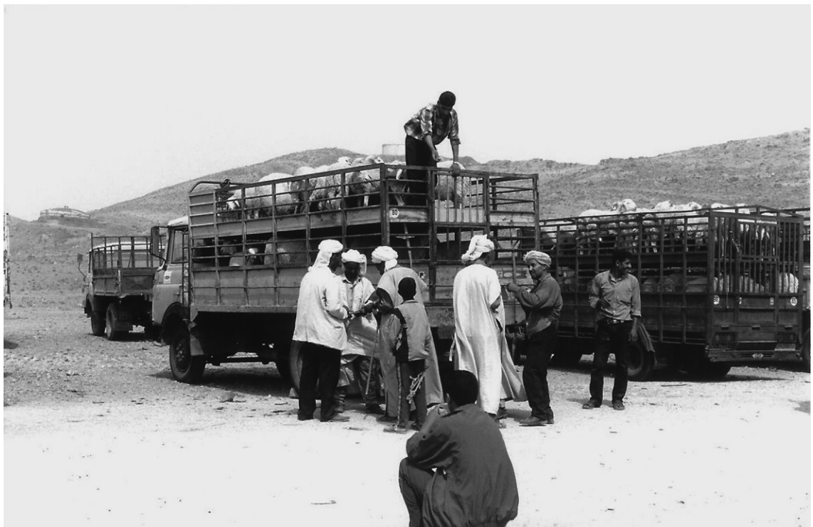
Un GAK au marché d'Ain Sefra