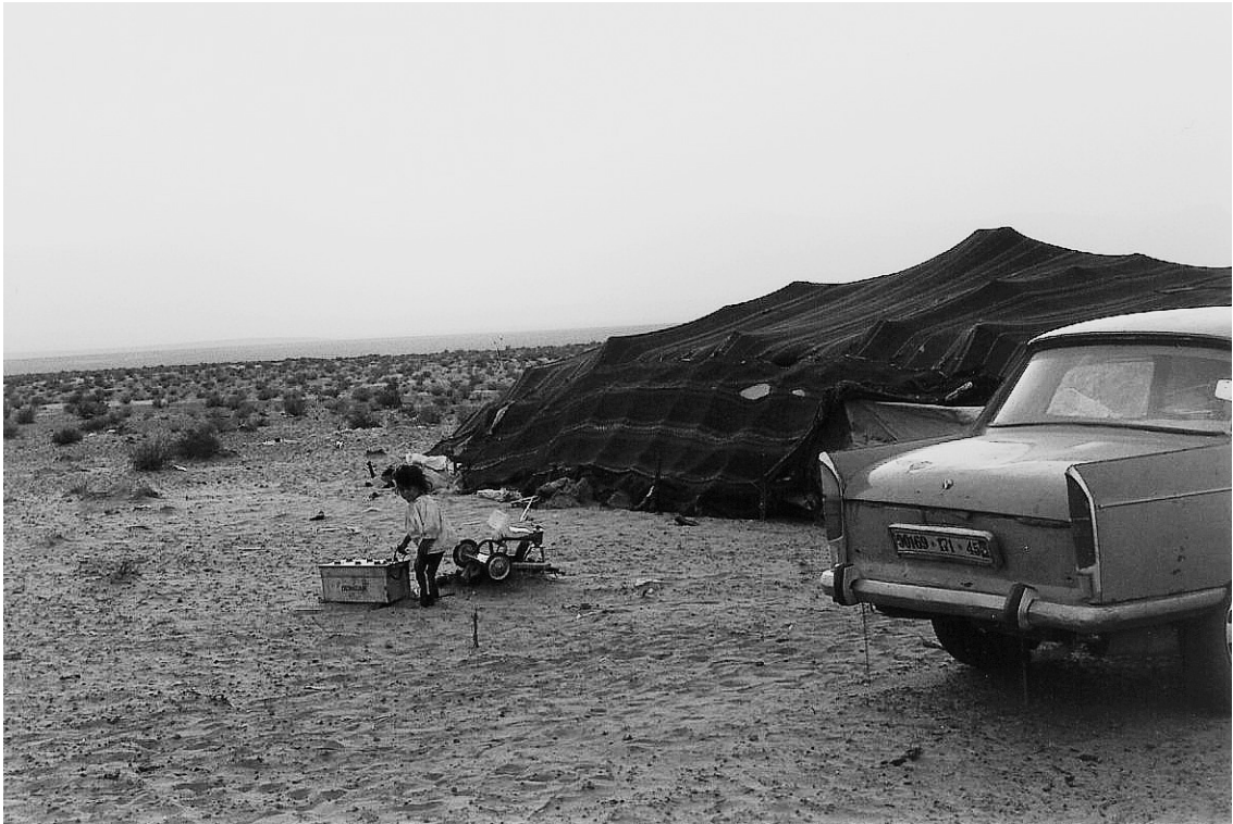
Khayma d'une famille semi-nomade