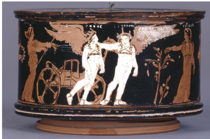
Figure 2. Aphrodite, Pothos, Êdulogos et Hygieia.