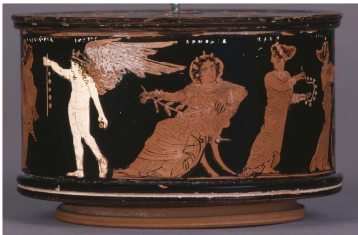
Figure 3. Eudaimonia, Himeros, Harmonia et Kalè.