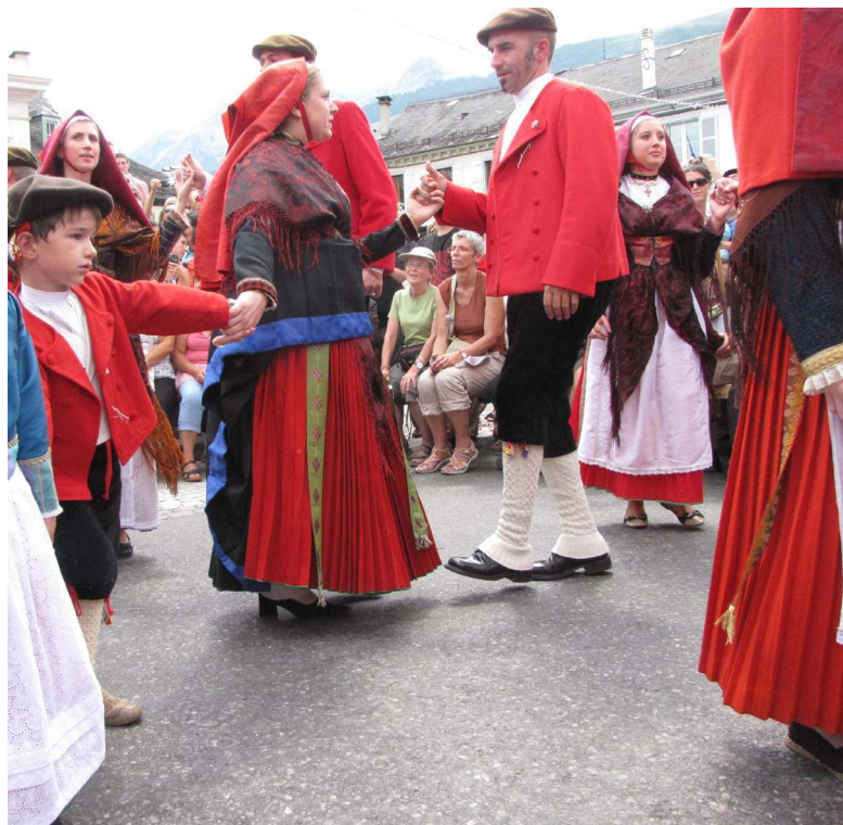
Figure 7. Bal ossalois à Laruns le 15 août 2012. La danseuse porte une robe à arregus sur une jupe rouge.