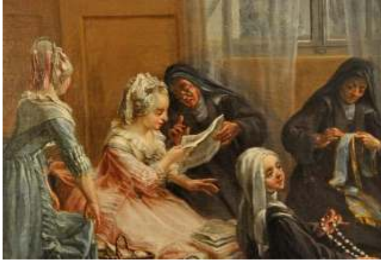
Figure 5. Guillot, Les carmélites au chauffoir . En rose, Louise de France. Saint-Denis, Musée d'Art et d'Histoire. Détail.