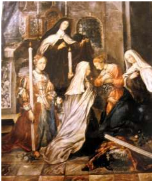
Figure 6. (Anonyme ?) Sainte Thérèse donnant l'habit à ses 4 premières postulantes , Espagne, 1711. La scène a été transposée dans un contexte de cour, alors que les postulantes étaient orphelines et le couvent d'Avila très pauvre ce 24 août 1562.